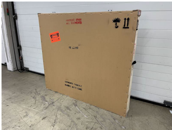
Gesamtverpackung mit Kennzeichnung